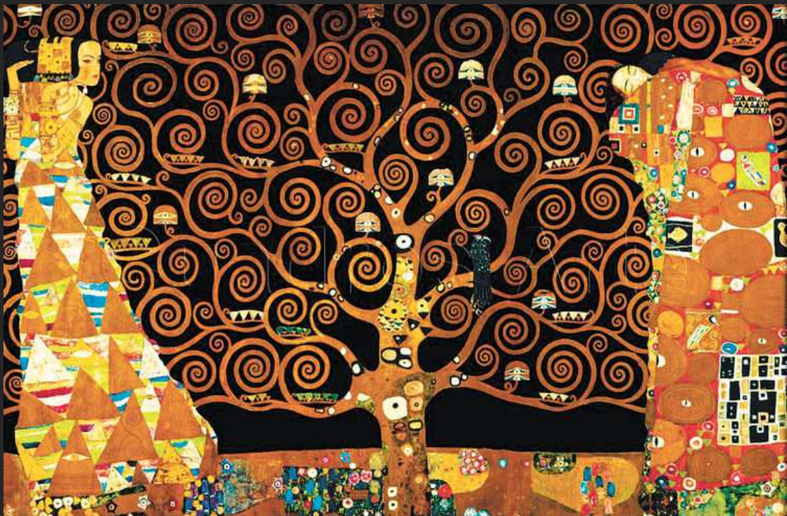
El árbol de la ciencia (1909). Gustav Klimt